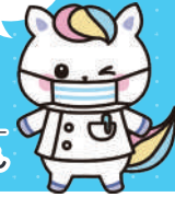
「看護の日」キャラクター かんごちゃん

就職希望者向け ○個別相談コーナー (※参加施設は裏面をご確認ください) ○自治体保健師等就職相談コーナー ○職場復帰相談・支援コーナー